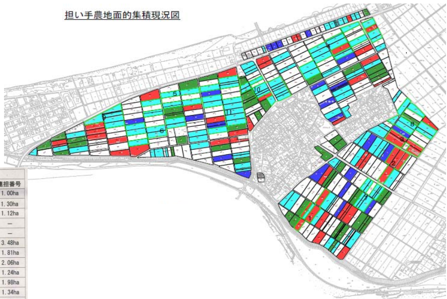
担い手農地集積現況図

経緯：①従来、事業実施地区の地図情報及び農地情報は、紙ベースでしか存在しておらず、現況の農地集積の状況把握や事業実施後の農地集積シミュレーションは、手作業による膨大な作業となり、多大な労力が必要だった。 ②平成24年1月より、水土里情報利活用促進事業で整備された地図情報及び農地情報を活用することで、迅速かつ的確に農地集積の現況図や集積計画図を作成することが可能となった。