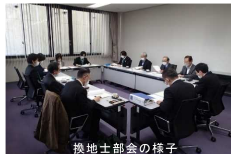
換地士部会の様子

次に、技術の向上を図るため、民法改正に伴う相続土地国庫帰属制度や令和6年4月1日より施行される相続登記の申請の義務化、相続人申告登記をはじめとした所有者不明土地等の課題解消に活用できる主な制度について情報共有を図り、また本年度島根県で開催された異議紛争処理実務研修会の事例について検討し、理解を深めました。会の中では、換地業務の実務的な質問や業務についての活発な意見交換が行われ、有意義な会となりました。令和6年度以降も換地技術者の技術の向上を図るために継続して換地士部会を開催することを決めて閉会しました。