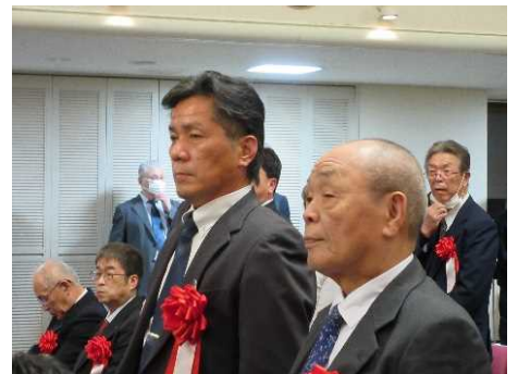
個人表彰を受けられた落合副理事長（右）と吉村前事務局長（左）