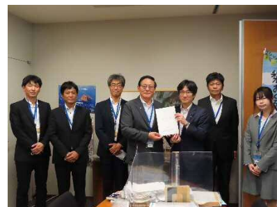
舞立昇治参議院議員