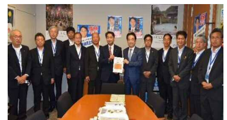
進藤金日子参議院議員に 要望書を手渡す協議会会員ら