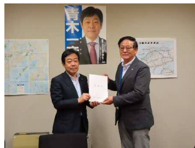
青木一彦参議院議員