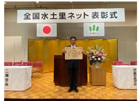
個人表彰を受けられた檜尾局長