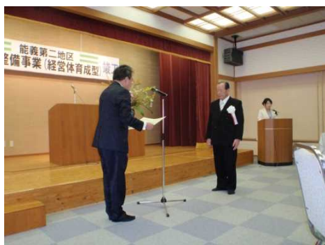
仲井会長へ感謝状贈呈

念碑の除幕式が行われ、その後、能義幼稚園児と県知事による記念植栽が行われました。