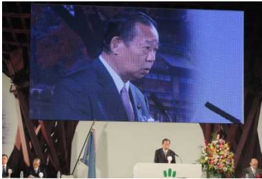
開会の挨拶をする二階全土連会長

第39回全国土地改良大会石川大会は、10月25日午後1時から、金沢市・いしかわ総合スポーツセンターで開催され、大会テーマ「水土里の明日を築く土地改良今こそ未来へつなぐ」の下、全国から約4300名の農業農村整備関係者が参集、本県からは27名が参加した。主催は、全国土地改良事業団体連合会(会長・二階俊博和歌山県土連会長/自民党幹事長)、石川県土地改良事業団体連合会。