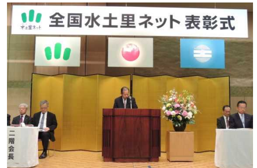
開会の挨拶をする二階全土連会長

表彰式では、土地改良功労者表彰で、農林水産大臣表彰5地区(うち県内1地区)、農村振興局長表彰2地区、団体表彰の金賞38地区、銀賞49地区(同1地区)、銅賞27地区(同1地区)、個人表彰116名(同2名)が受賞。農業農村整備優良地区コンクールでは、農林水産大臣賞4地区(同1地区)、農村振興局長賞6地区、全国水土里ネット会長賞10地区が受賞した。また当日は21世紀土地改良区創造運動の表彰式も行われ、大賞2地区、部門賞3地区、さなえ賞3地区が表彰を受けた。(県内受賞者は4頁に掲載)