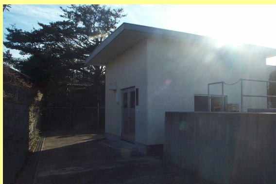
【管理施設の整備補修に】

土地改良施設に係る維持管理（整備補修）に対しては、国の補助事業により一定の助成が行われており、事業に必要な経費のうち、国等の補助金以外の受益者が負担する部分（分担金といいます。）については、農業基盤整備資金の融資対象となっています。また、土地改良区等が国の補助を受けないで行う土地改良施設の整備補修についても幅広く農業基盤整備資金の融資対象としているほか、土地改良区の事務所建設に要する費用や事務機器、巡回用車両の購入等についても、融資を受けることができます。