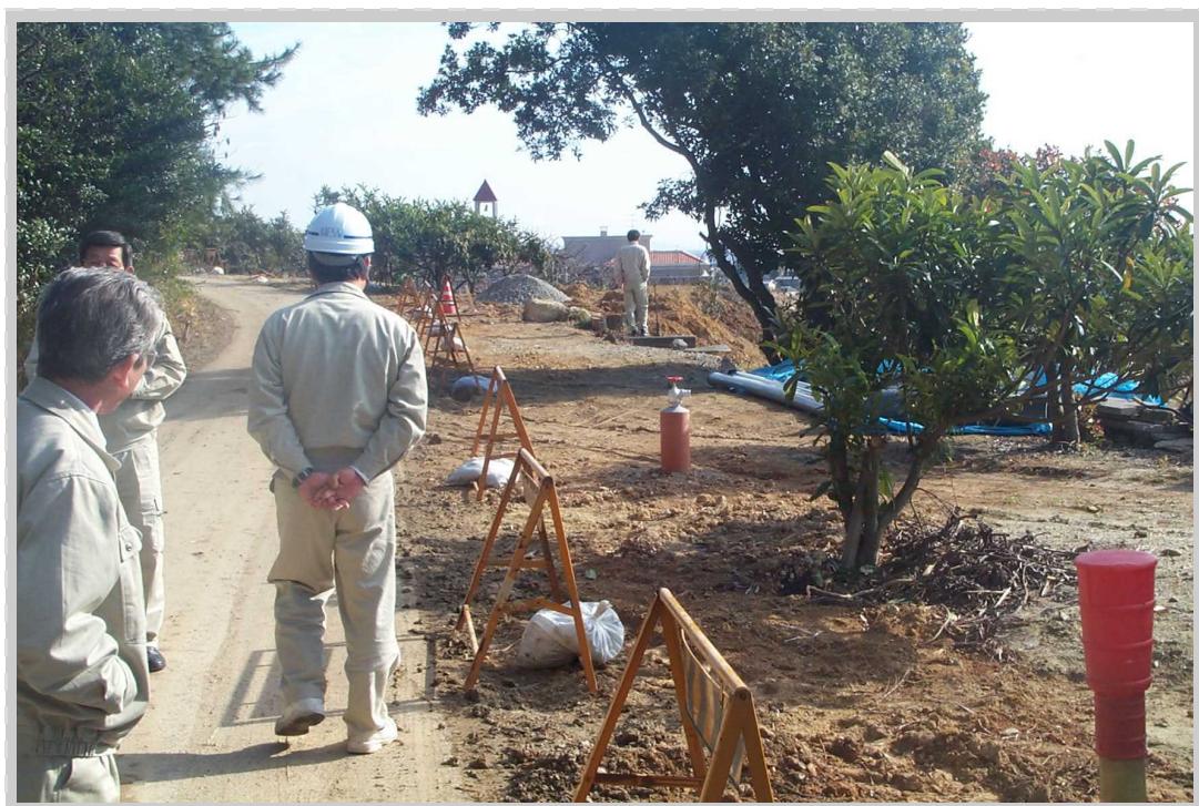
パイプラインの補修作業

農業基盤整備資金は、土地改良区などが行う土地改良施設の維持管理事業に対して、用排水路や農道などの補修は勿論のこと、土地改良区の事務所の建設、事務機器や巡回用車両等の購入など、維持管理事業のあらゆる用途に幅広くご利用頂けます。