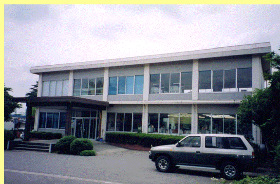
【土地改良区事務所の新增築に】